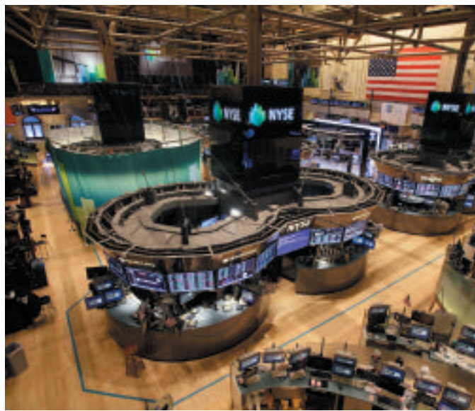
Una veduta della borsa di New York, a Wall Street

CheBanca! Premier Banking Gruppo Mediobanca