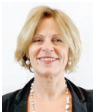
FOSCA GIANNOTTI È DIRETTORE DI RICERCA DELL'ISTITUTO DI SCIENZA E TECNOLOGIE DELL'INFORMAZIONE DEL CNR DI PISA

Il progetto è nato al Data Mining Laboratory (Kdd Lab) di Pisa, in cui Giannotti e il suo team hanno dato inizio al percorso che li ha portati all'Erc. «Lavoriamo per un avanzamento tecnologico che pongesse al centro l'essere umano (la cosiddetta «Human AI»), insieme con i suoi diritti e i suoi valori: una tecnologia che garantisca il rispetto della privacy e assicurasse l'uso di algoritmi trasparenti e non di-