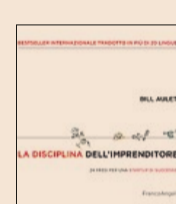
"La disciplina dell'imprenditore" di Bill Aulet, Franco Angeli, 35 euro. In uscita oggi in Italia

inventare una tecnologia per costruire un'azienda di successo è una tesi sostenuta dai dati provenienti dallo stesso Mit dove, dal 2005 a oggi sono state avviate più di 2.500 imprese e ogni anno ne nascono in media altre 900. Un ecosistema che dà lavoro a più di tre milioni di persone con ricavi totali di circa 2 mila miliardi di dollari, una cifra aggregata a livello dell'11ma potenza economica mondiale. I dati del Technology Licensing Office mostrano però che oltre il 90% delle startup fondate da ex studenti del Mit sono costitu-