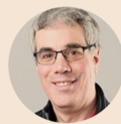
Startupper in cattedra. Bill Aulet, docente al Mit di Boston, ha creato tre startup. Prima è stato giocatore di basket

zioni di grande successo che popolano il nostro mondo oggi, da iTunes a Salesforce, Netflix, Spotify e molte altre, utilizzano delle tecnologie, ma devono il proprio successo ai modelli di business. Car2Go, ad esempio, non potrebbe gestire la sua flotta di auto senza i sistemi keyless che permettono agli utenti di accedere all'abitacolo e avviare il veicolo senza chiavi. L'innovazione messa in campo da questo come da altri car sharing è il considerare il noleggio a breve termine dell'auto come un'alternativa al possesso. Che non sia necessario